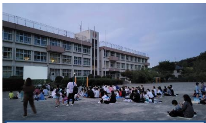
星空シアター開会前