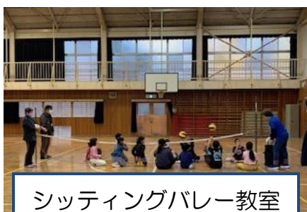
シッティングバレー教室