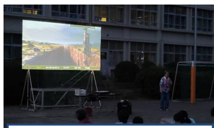
星空シアター開会直前