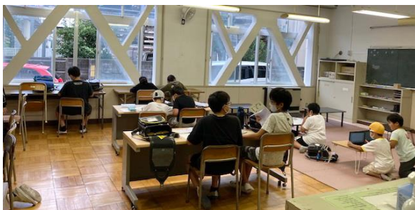
放課後のへや（自習室）