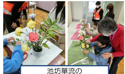
池坊華流の いけばな教室風景