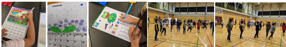
マイカレンダー作り