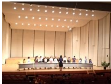
ハンドベルの発表