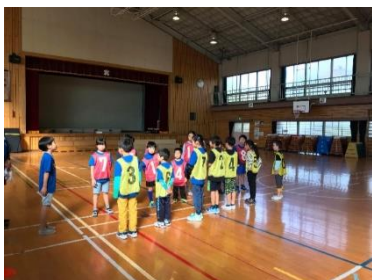
スポーツ鬼ごっこ