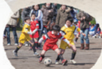
体操指導・サッカー