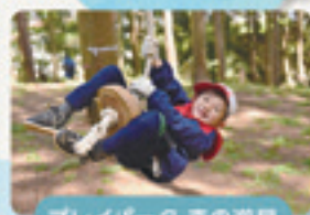
プレイパーク 森の遊具