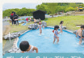
プレイパーク ジャブジャブ池