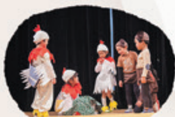
ごっこ遊び・劇遊び

親子行事に参加することで 子供の成長を喜び 幸せを感じられるように 家族を応援します。