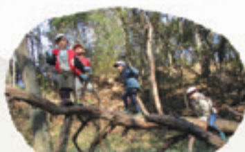
森のようちえん活動